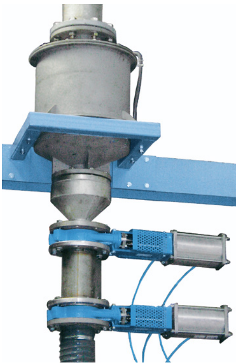
Fig. 2 : Cyclone pour matières lourdes