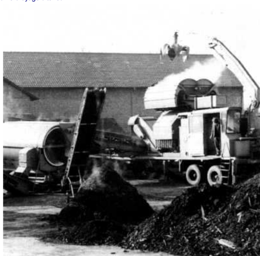
modèle mobile pour compostage d'écorces.