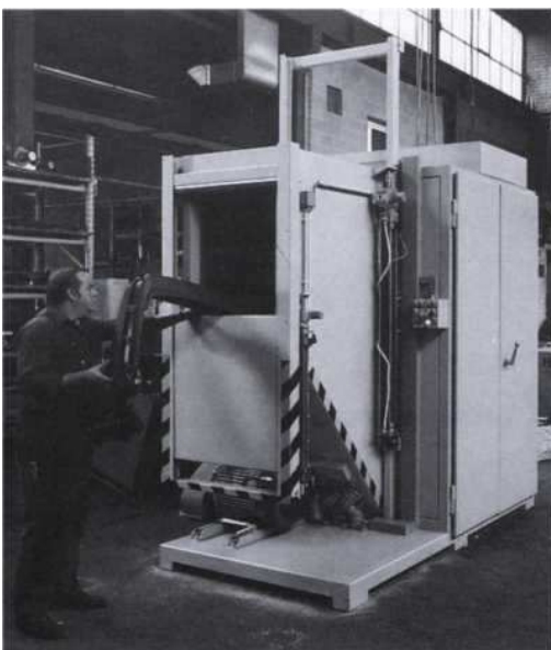
Broyeur avec trémie en position d'alimentation