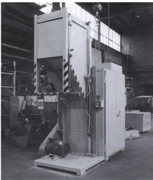
Broyeur avec trémie en position de travail