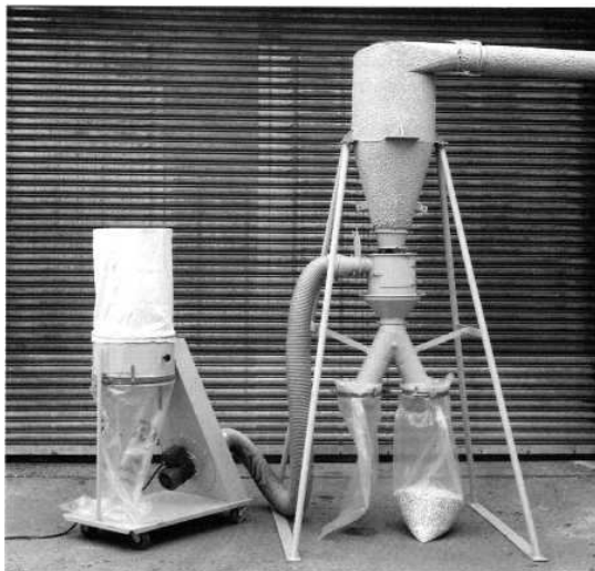
Zyklonabscheider mit Feingutabscheider HS 300 (Absackausführung)

Der Feingutabscheider ist kompakt gebaut und kann unter jeden Mahlgutauslauf angebaut werden.