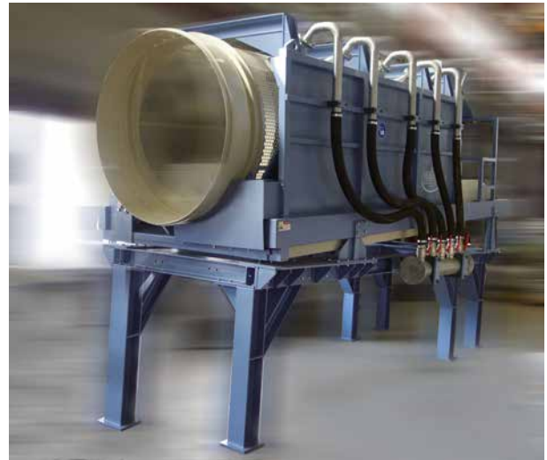
Abb. 1: Vorwaschtrommel