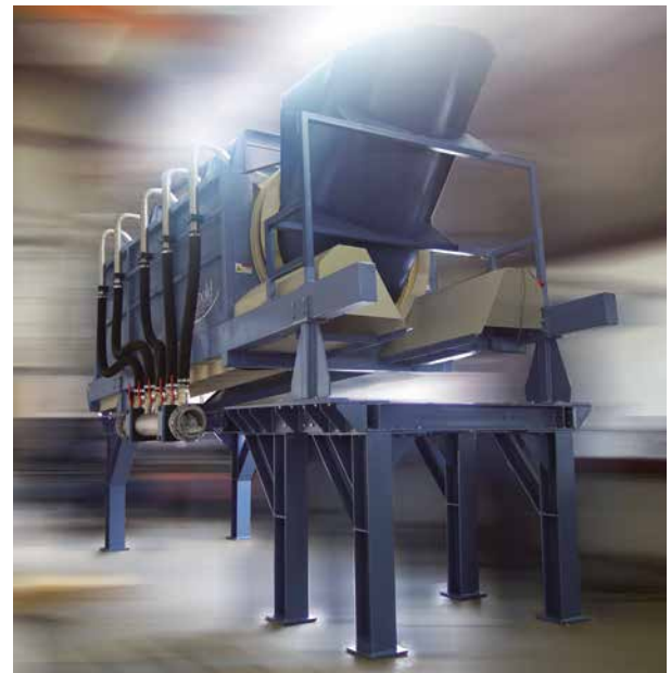
Abb. 2: Vorwaschtrommel