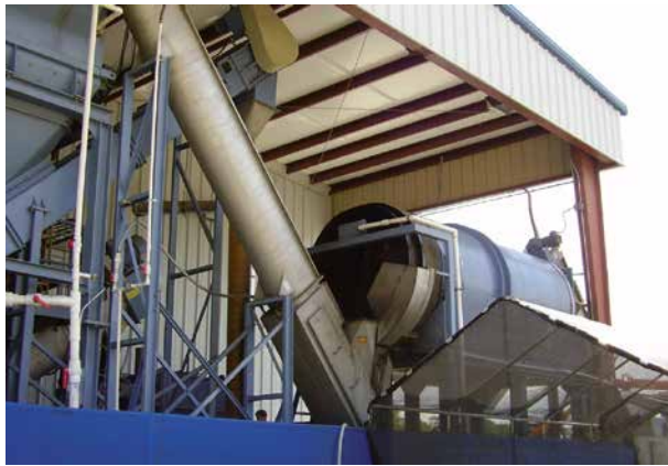
Abb. 5: Waschtrommel Landwirtschaftsfolie mit Förderschnecke