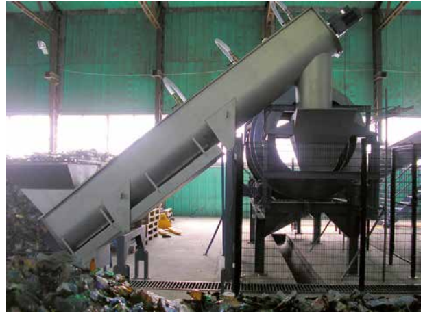
Abb. 4: Waschtrommel PET mit vorgeschalteter Förderschnecke