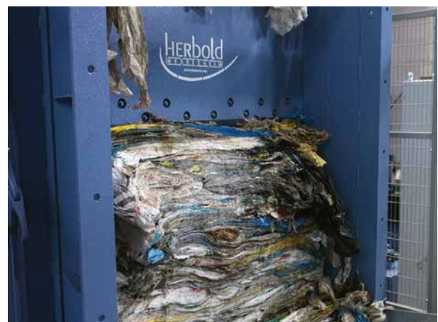
Abb. 2: Zerteilung der unter dem Spaltermesser liegenden Materialportionen