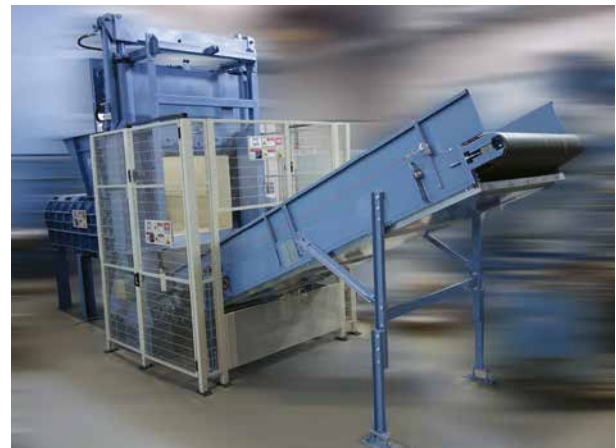
Abb. 1: Guillotineschere HGS 150 mit EWS Vorschub