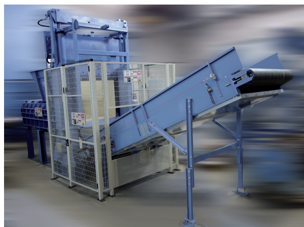
Fig. 1 : Guillotine HGS 150 équipée du système d'avance du déchiqueteur EWS