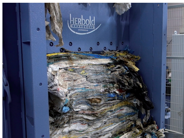
Fig. 2 : Sectionnement des portions de matière se trouvant sous le couperet