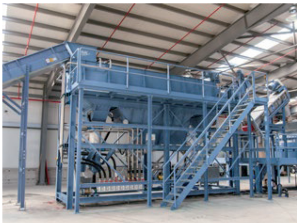
Fig. 1: VWE 600/2

La unidad de prelavado VWE 600/2 combina la función del separador de cuerpos extraños con un prelavado del material de alimentación. La unidad de prelavado separa en tres pasos de proceso integrados, los cuerpos extraños como piedras, metales, cristales, arena, papel del material a triturar, hace pasar el material a triturar por un proceso intenso de lavado y en el tercer paso los cuerpos extraños de peso ya separados, descienden.