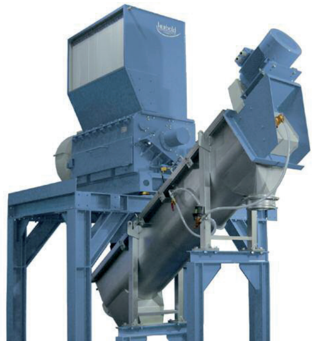
Abb. 1: SML 60/145 mit einem Friktionswäscher des Typs FA 3000.

Für nähere Einzelheiten über die Modelle SML und SMS siehe Prospekte der Standardproduktpalette.