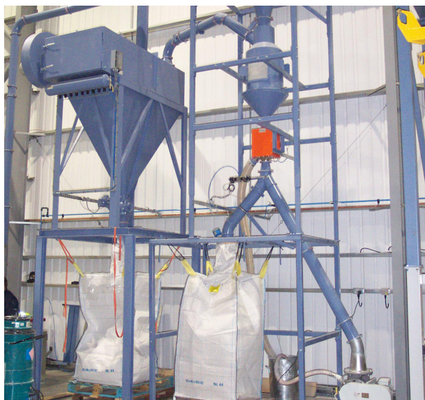
Циклонный сепаратор с сепаратором мелких фракций HS 300 (исполнение со станцией фасовки)

Новый сепаратор имеет компактную конструкцию и подходит для установки под любое устройство для выгрузки измельчаемого материала.