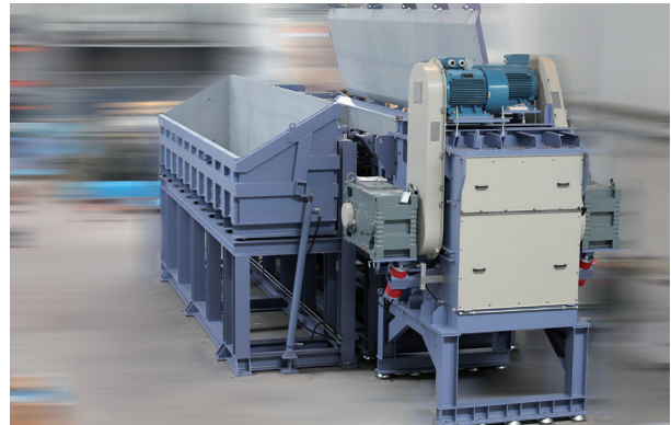
Étape 1: La matière à traiter est déposée dans la benne basculante