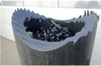
Fig. 1: Matière chargée: par ex. tuyaux de refoulement en PE