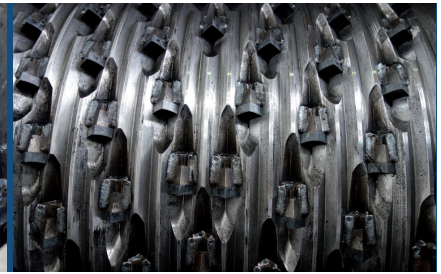
Fig. 3: Rotor du déchiqueteur EWS-R