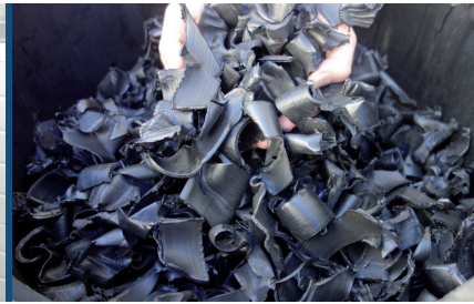
Fig. 2: Produit final