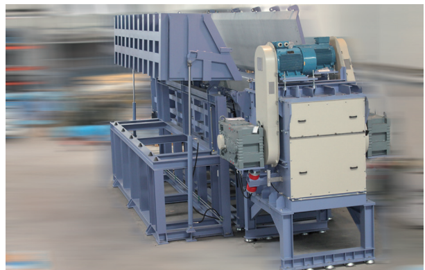
Étape 2: La benne déverse la matière dans la cuve