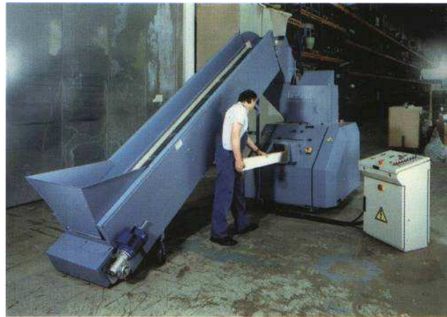
SMP 45/70 'C' mit Komplettschallschutz und Zusatzeinlauf für Kurzstücke

Die Herbold Schneidmühlen des Typs SMP sind eigens entwickelt worden, um lange Rohre, Platten und Profile ohne Vorablängen horizontal beschicken zu können. Der Vielmesserrotor dieser Schneidmühle ist so gestaltet, daß er nach Eingabe der Rohre und Profile in den Zuführschacht diese selbsttätig einzieht.