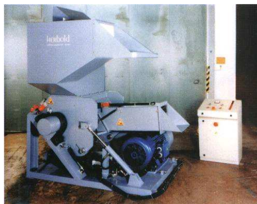
SMP 45/70 mit horizontalem Einzugsschacht und Zusatzeinlauf, ohne Schallschutz