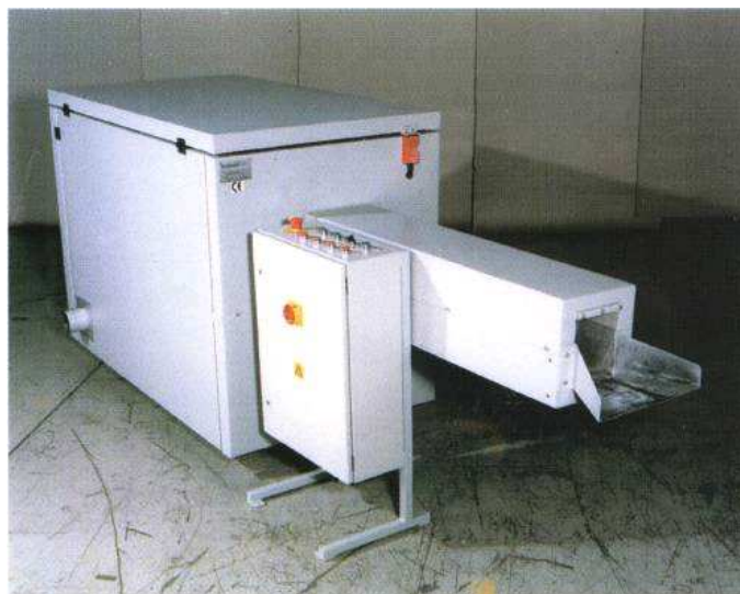
Herbold Rohrschneidmühle Typ SMP 22/30 EV mit Rolleneinzug und horizontalem Beschickschacht, voll schallisoliert