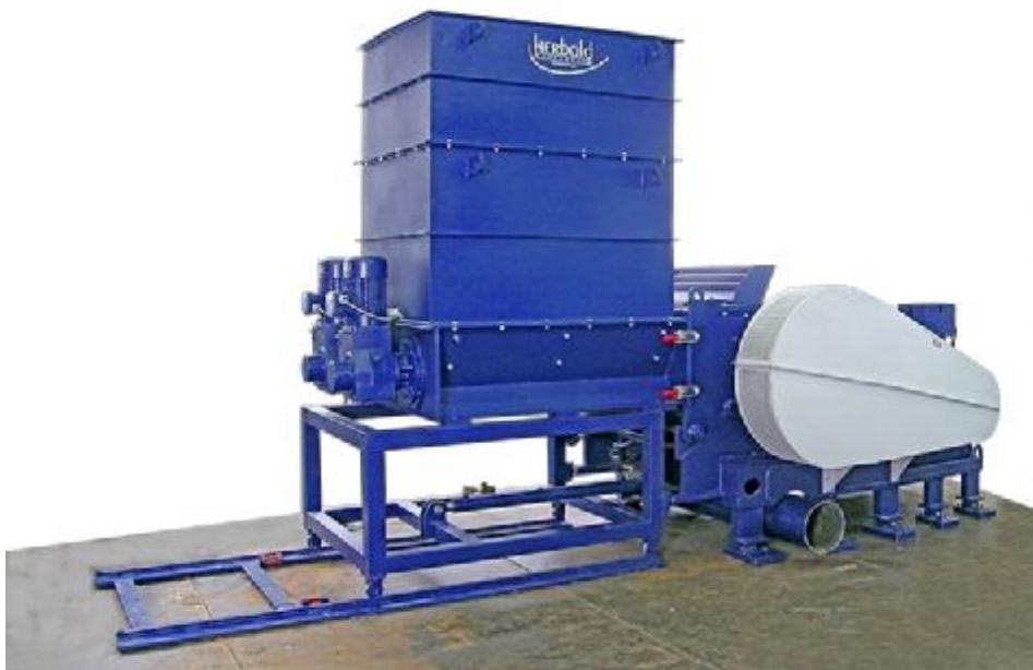
Photo HERBOLD Granulator model SML 60/100

Als besonderen Vorteil für den Anwender ergibt sich die Möglichkeit größerer Produktmengen in den Speicherbehälter aufzugeben und diese Menge automatisch zu verarbeiten. Ein kontinuierliches manuelles Beschicken der Materialzuführung durch den Bediener entfällt. Ebenfalls bietet diese Art der Zuführung dem Betreiber ein hohes Sicherheitsniveau durch gänzlich Vermeiden von Herausschleudern des aufgegebenen Produkts. Durch das Entfallen der typisch großen Öffnung für Förderband und/oder Handaufgabe ergibt sich weiterhin eine geringere Schallemission bei der Zerkleinerung. Belademöglichkeiten ergeben sich jetzt mit Gabelstapler oder Kippmulde.