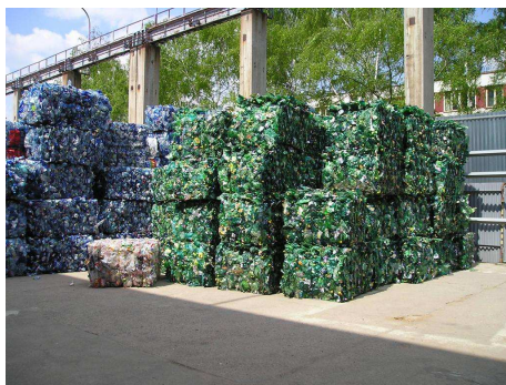
Fig. : Bouteilles PET